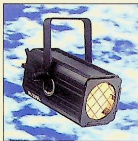
C 51 15 - 60° Lentille prisme-convexe pour un faisceau diffus à bords semi-nets.