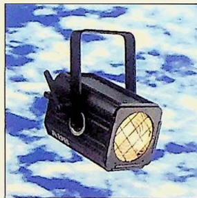
F 51 18 - 38° Lentille Fresnel pour un faisceau à bords doux. Extrêmement compact seulement 2,2 kg !