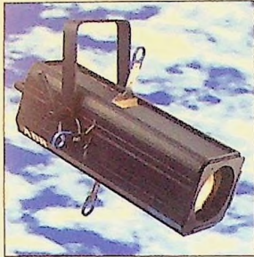
DS 51 18 - 38° Projecteur à découpe zoom pour un faisceau net et précis.